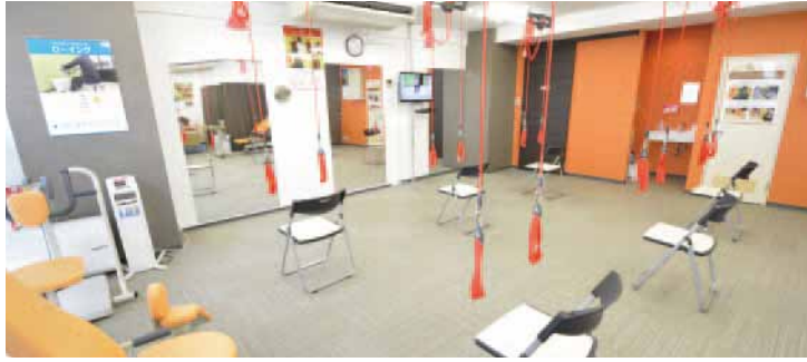
喜びや幸福感、親しみ、元気、明るいといったポジティブさをイメージしたオレンジがコンセプトの店内