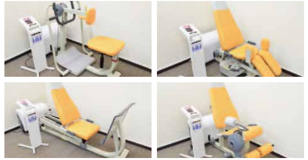
高齢者向けトレーニングマシンウェルトニックシリーズ 4 台