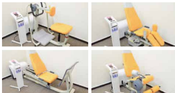
高齢者向けトレーニングマシンウェルトニックシリーズ4台

喜びや幸福感、親しみ、元気、明るいといったポジティブさをイメージしたオレンジがコンセプトの店内