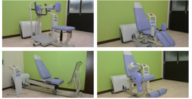
高齢者向けトレーニングマシンウェルトニックシリーズ4台