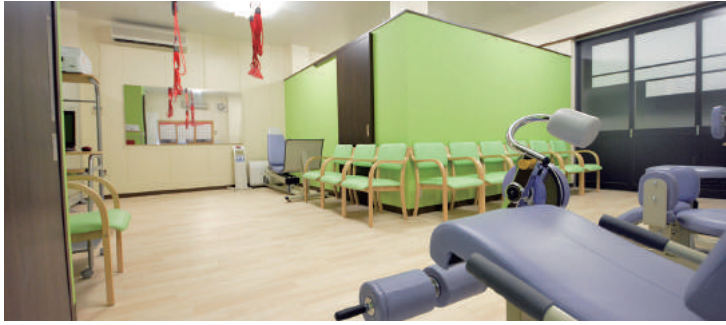
疲れを癒やす緑と、コツコツと物事を継続させる茶色のカラーコンセプト