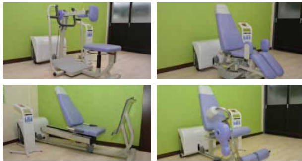
高齢者向けトレーニングマシンウェルトニックシリーズ 4 台

木のぬくもりが心地よさを感じさせます。 明るい雰囲気の中でリハビリに取り組むことができる施設デザイン。