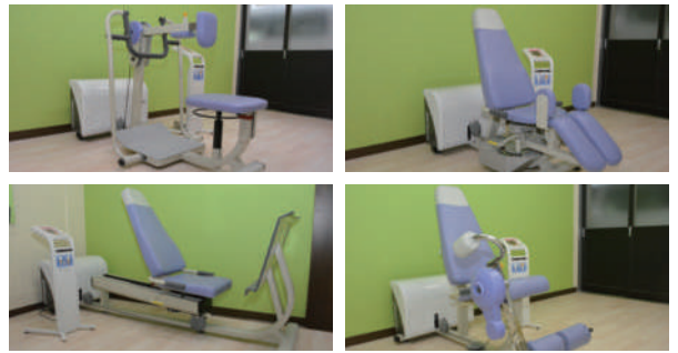
高齢者向けトレーニングマシンウェルトニックシリーズ 4台

木のぬくもりが心地よさを感じさせます。 明るい雰囲気の中でリハビリに取り組むことができる施設デザイン。