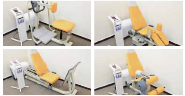
高齢者向けトレーニングマシンウェルトニックシリーズ 4 台

喜びや幸福感、親しみ、元気、明るといったポジティブさをイメージしたオレンジがコンセプトの店内